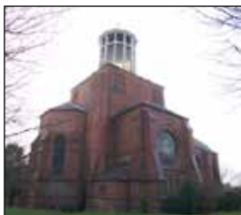
Kiel: Evangelische Jakobi-Kirche

Das Erntedankfest feiern wir in mittlerweile „guter Tradition“ gemeinsam mit der evangelischen Hauptkirchengemeinde St. Trinitatis am Sonntag, 3. Oktober, um 10 Uhr in einer ökumenischen Messe. Dazu sind alle Gemeindemitglieder herzlich eingeladen.